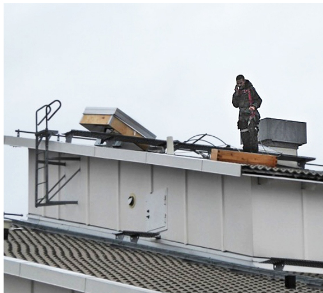
Ny röklucka installeras.

Enligt lag ska varje lägenhet ha minst en fungerande brandvarnare. Det är en billig och effektiv livförsäkring. Ta för vana att testa brandvarnaren t.ex. till advent varje år. Vid den obligatoriska ventilationskontrollen i vår kommer vi att kontrollera att alla lägenheter har fungerande brandvarnare.