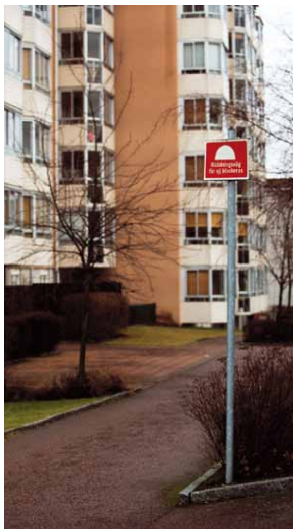
Räddningsvägar ska hållas snöröjda och fria från andra hinder.

Garage förses lämpligast med pulversläckare eftersom pulver är effektivt mot motorbränder. En sådan fungerar på de flesta typer av bränder och kan användas även för övriga utrymmen. Handbrandsläckare riskerar att bli stulna. Vill man ha släckutrustning i allmänna utrymmen kan vattenslang på rulle i ett fast skåp vara ett bra alternativ.