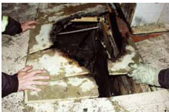
Felaktigt hanterad aska är en vanlig brandorsak. Här har golvet brunnit när aska från en kakelugn som det eldats i dagen före ställts i en plastpåse på golvet.

Bränder i bostäder är ofta eldstadsrelaterade. Därför är det viktigt att uppmärksamma säkerheten kring eldstäder. De boende behöver informeras om vad som gäller för de lokala eldstäder som finns i fastigheten, exempelvis kakelugnar och öppna spisar. Viktig information är om det får eldas i dessa, vad som i så fall får eldas, i vilken omfattning det får eldas och hur askan ska hanteras.