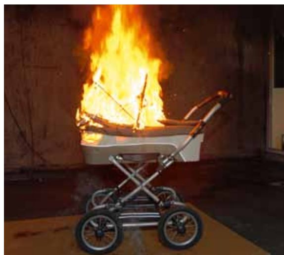
Håll trapphuset fritt från brännbart material och sådant som är i vägen vid en utrymning.

uthyrningen är det lämpligt att den som hyr ut lokalen för en dialog med hyresgästen om hur brandskyddet är tänkt att fungera när det gäller utrymningsvägar, tillåtet antal personer, eventuella larm med mera. I vissa fall kan det också vara lämpligt att tillsammans gå igenom lokalen/lokaler innan de tas i bruk för arrangemanget. Det bör också finnas någon form av skriftlig brandskyddsinformation och checklista till hyresgästen. Sådana bör också vara uppsatta i lokalen.