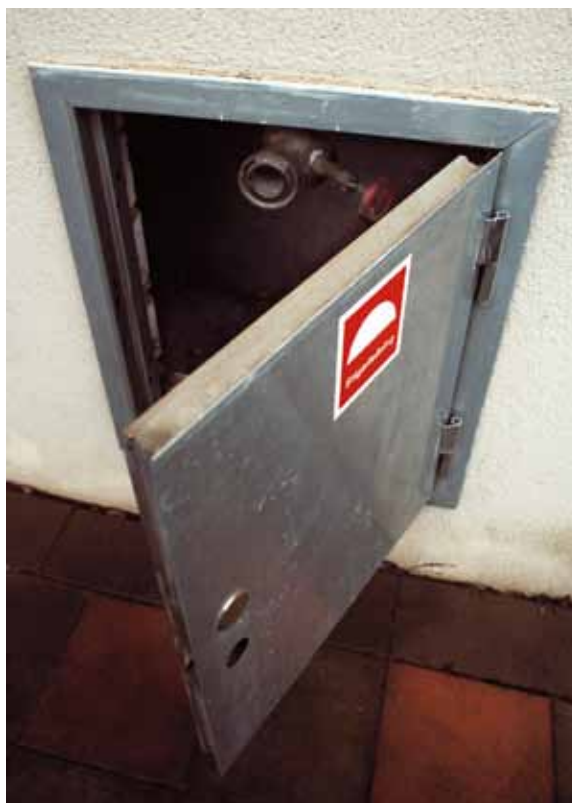
I stigarledningen i luckan på fasaden kan räddningstjänsten koppla in vatten. Inne i trapphuset finns sedan uttag där slangar kan anslutas.

I trapphus utgörs brandventilationen ibland av vanliga öppningsbara fönster. Det är viktigt att se till att lekande barn inte kan falla genom dessa. För att hindra olyckor kan exempelvis ett utvändigt galler användas.