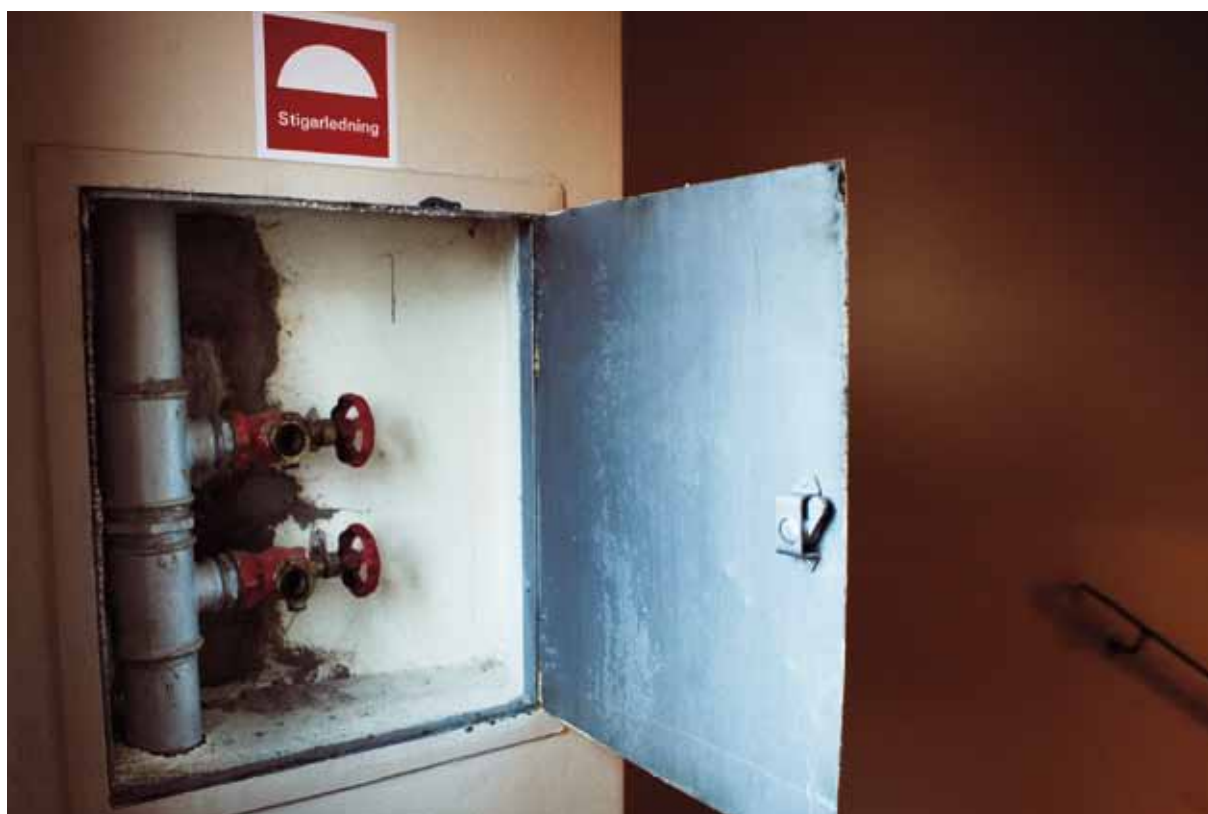
Via stigarledningen i trapphuset får räddningstjänsten vattenförsörjning utan att behöva dra slangar hela vägen från bottenvåningen.