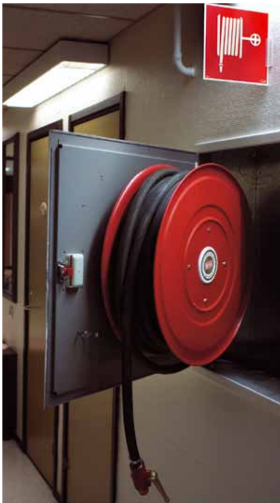
En vattenslang i styv plast är lätt att hantera och finns alltid på plats.