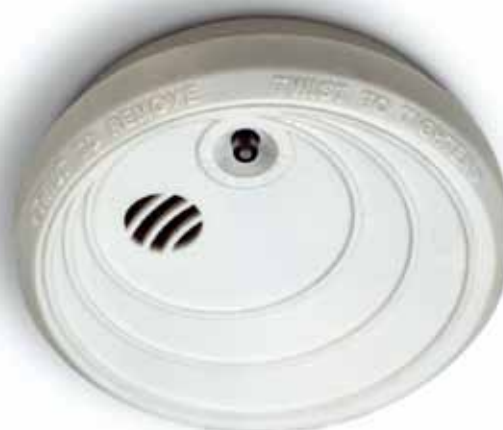
Det ska finnas minst en uppsatt och fungerande brandvarnare i varje lägenhet. Billigare liv- och egendomsförsäkring är svårt att hitta.

brandvarnare installeras, men att de boende sedan själva ansvarar för att regelbundet prova att den fungerar och byta batterier vid behov.